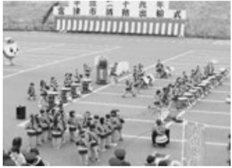
▲ 昨年の 幼年消防 クラブの 演奏