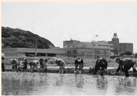
▶横一列に並びみんなでお米を植える

参加者みんなでお米を植えたところ以外には機械で植えました。田植機に順番に乗せてもらえることになり、子どもたちは大喜びでした。