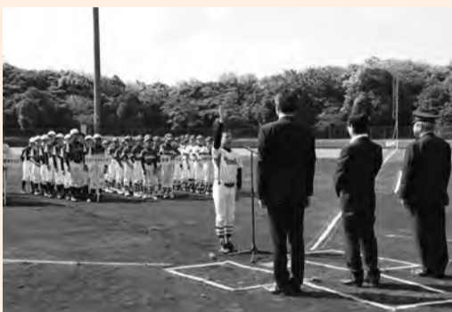
▶気迫のこもった選手宣誓

5月5日、市民ふれあい公園で、「第33回富津市少年野球夏季大会」、「第24回富津市教育長杯サッカー大会」が行われました。