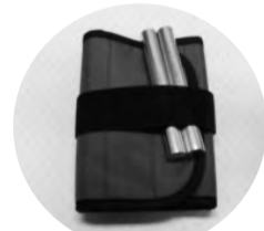
▲使用する重りとバンド

体を動かすのがおっくうにならなくなりました。毎週、みんなで集まって体操するのが楽しくて継続できています。