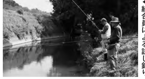
▲組合員による試し釣り