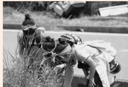
▶友達と一緒に自然観察

普段あまり歩いたことのないところでもいろいろなものを見つけては、立ち止まって観察をするなど楽しい時間を過ごしていました。