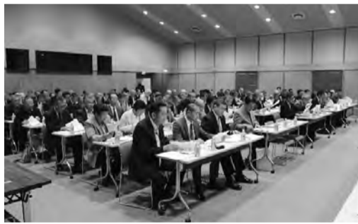
▲4月21日に行われた区長会議