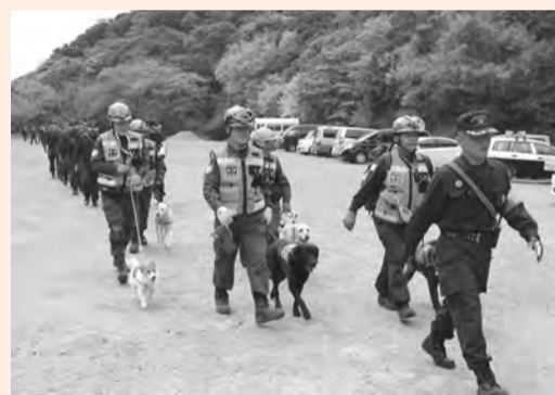
▶鋸山のパトロールに出動!

市内には、多くの方が訪れる鋸山や高岩山があります。ハイキング気分に登れる山ですが、思わぬ事故が発生しています。