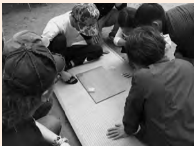
◀▲自慢のクモの戦いに一喜一憂