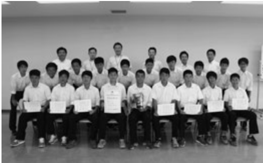
▲全国大会出場報告会にて

8月、富津市建設関連5団体連合会と「地震・風水害・雪害その他の災害応急対策に関する業務基本協定」を締結した。 11月、社会福祉法人(8法人)と「災害時における福祉避難所の設置運営に関する協定」を締結した。