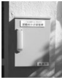
▲設置した自動解錠ボックス

指定避難所のうち、青堀小、富津中、大貫中、天羽中の体育館に、震度5弱以上の地震を感じると解錠する装置が内蔵された「避難所自動解錠ボックス」を県内で初めて設置した。避難者自ら解錠し、避難所に入ることが可能となった。