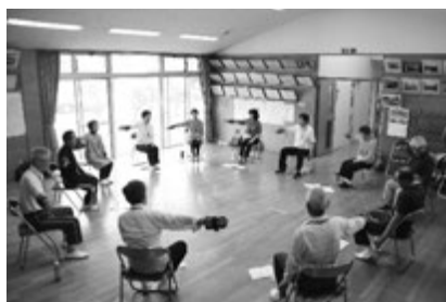
▲早くから、「富津市いきいき百歳体操」に取り組んでいる大堀二区の皆さん

健康寿命を延ばし、住み慣れた地域で生き生きとした生活を送れるよう、「富津市いきいき百歳体操」を開始した。