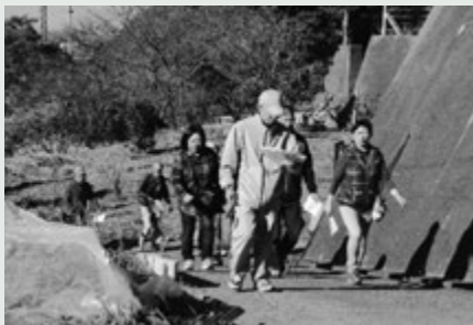
5分おきに現在地を地図に書き込みながら避難しました。

今回の訓練では、5分以内に避難できた人は参加者の42.3%、10分以内に避難できた人は74.5%という結果となり、参加者からは「実際の地震のときにはもっと時間がかかるだろうから、日ごろからの準備が大切だと実感した。」との感想がありました。