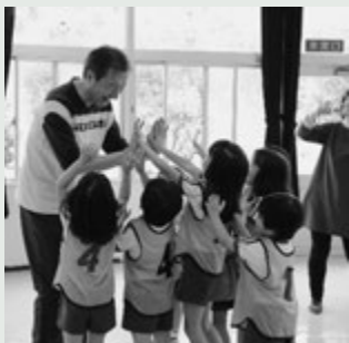
サッカーゲームで対戦した後、園児たちとハイタッチする市長

お昼には、園児たちに囲まれて給食を一緒に食べ、いろいろなお話しをして和やかな時間を過ごしました。