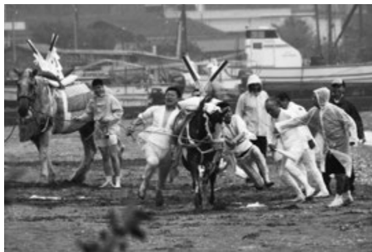
▶今年行われた馬だし祭り

これまで県指定有形民俗文化財として指定されていた「吾妻神社の馬だし祭用具」を含めて、祭礼そのものが県指定無形民俗文化財となった。