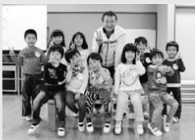
最後にみんなで記念撮影をしました。

終わりの会では、園児たちからお礼の言葉と手作りのプレゼントが贈られ、市長は、「今日は一緒に遊べて楽しかったです。これからもみんなで仲良く、楽しく過ごしてくださいね。」とメッセージを贈りました。