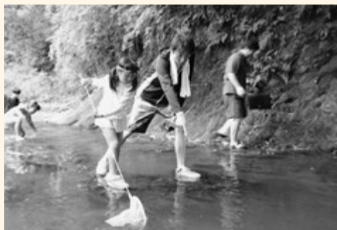
お父さんと一緒に魚を発見！

当日は54人が参加し、相談員の人から説明や注意を受けた後、一斉に川に入り、魚や水中の虫を捕まえ大はしゃぎでした。