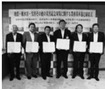
富津市建設関連5団体連合会の皆さんと市長