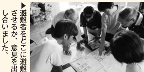
避難者をどこに避難させるか、意見を出し合いました。

当日は、中学生だけではなく、民生委員や青少年相談員、区長など地域の人たちも含め、約100人が参加し、それぞれグループに分かれ