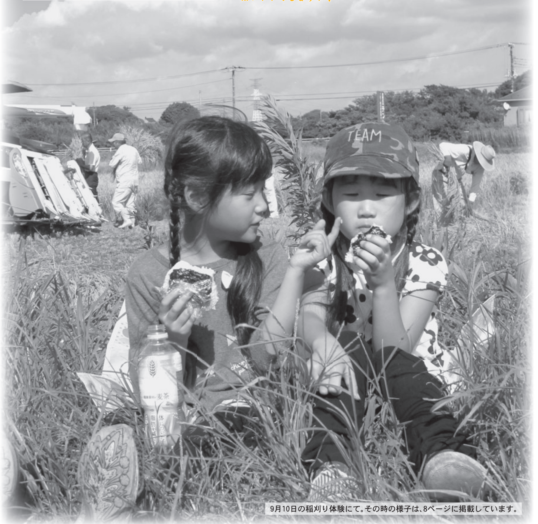
9月10日の稲刈り体験にて。その時の様子は、8ページに掲載しています。