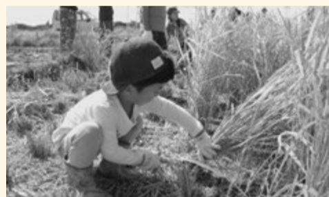
鎌にも慣れて、一生懸命刈りました。

そして、富津産のお米と海苔を使用したおにぎりが配られ、「おいしい！」と夢中で食べていました。