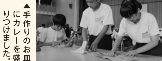
手作りのお皿にカレーを盛りつけました。