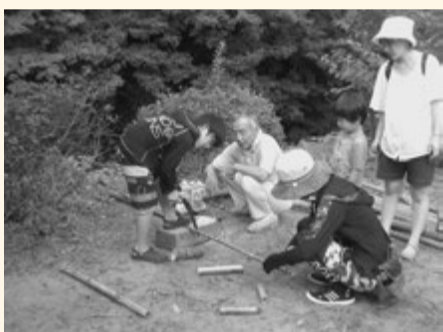
教えてもらいながら、竹馬作りに挑戦。

中には、川底にできた浅いくぼみで泳いでいる子もいて、それぞれ自分で考えた川遊びを満喫していました。