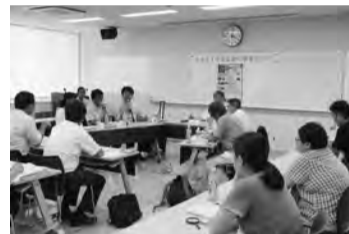
▲昨年度の事業仕分け

当日は、事業仕分けの様子を傍聴できます。予約は不要ですが、傍聴人の人数により、会場に入れない場合があります。なお、インターネットで生中継も予定しています。