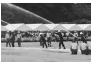
千葉県大会の様子

7月23日に千葉県消防学校で行われました。君津支部消防操法大会で最優秀賞を受賞した第7分団第2部が君津支部代表として出場し、努力賞を受賞しました。