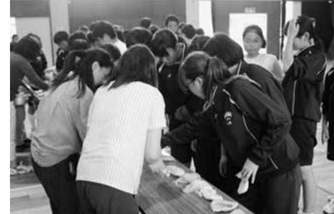
▶湯せんで米飯を炊き出す訓練 (6月25日の佐貫中学校)

避難所は、自宅の倒壊などで居住が困難な人が生活する場です。市は側面から支援しますが、避難所の運営は避難者自身で行います。