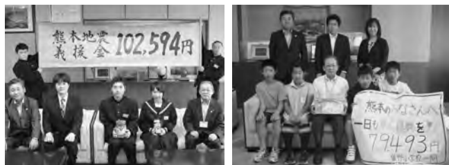
▲両校とも、地震が発生した4月中に、積極的な義援金の呼びかけを行いました。

5月2日に富津中学校生徒会から102,594円、6月3日に飯野小学校児童会から79,493円が寄附されました。 ☎社会福祉課 ☎80・1258