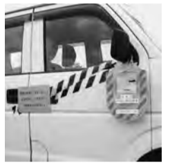
ミラーズロック設置例