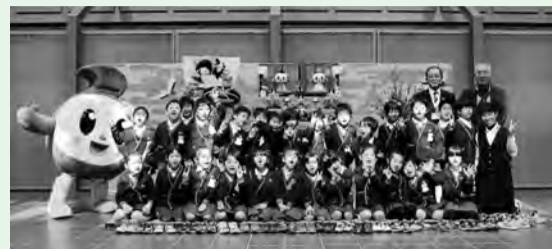
▲「ふつつ～ん！」の掛け声とともに、富津保育園の園児が記念撮影

そして、最終日には富津保育園の年長組の園児が見学を訪れ、女の子はふつつんが飾られた7段飾りのひな壇に、男の子は子どもたちを出迎えるためにやってきた着ぐるみのふつつんにすっかり夢中。見学の最後は、ひな壇を前にみんなでふつつんと記念撮影をしました。