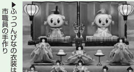
▶ふつつんびなの衣装は市職員の手作り

これはひな祭りにちなみ、来庁する人たちへの憩いとなるようにと企画したもので、ふつつんをお内裏さまとおひなさまに見立て、ひな人形の寄贈元である「人形の勝」様のご厚意で巨大羽子板も展示しました。