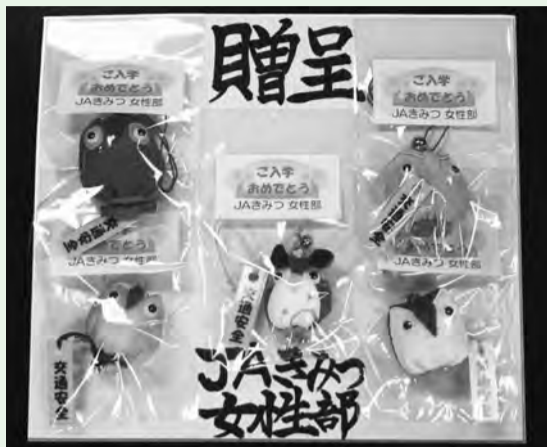
▲ふくろうの種類はさまざま