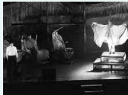
▲太鼓の音色を背に、風の神様が登場する1シーン。

生演奏・歌・民俗芸能・世界中の舞踊を取り入れたバラエティに富んだ内容で、訪れた人たちは、ステージで繰り広げられる幻想的な舞台劇を楽しんでいました。