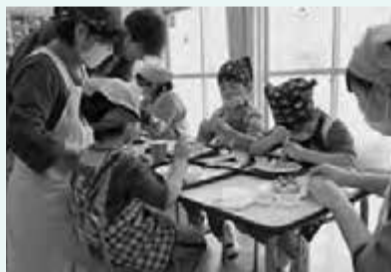
▶子どもたちの思いの発想で、バウムクーヘンが彩られました。

子どもたちは、できあがった自分だけのオリジナルデコバウムを、笑顔いっぱいほおぼって食べていました。