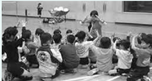
▶みんな、トスのコツを教わりました。

参加した子どもたちは、明るく楽しく指導する2人のコーチと一緒に、バレーボールやスポーツの魅力を学んでいました。