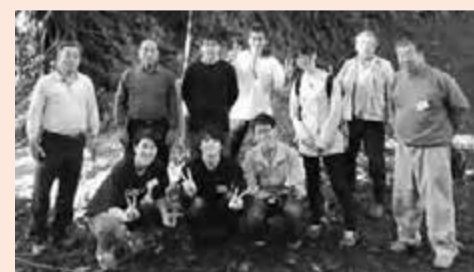
▲保全会とむら塾の皆さんで現地を見学

地元の『谷田皿引農地水保全会』が環境保全活動や歴史の伝承を行う中、昨年からは農林水産省の紹介で東京大学のサークル『東京大学むら塾』と連携し、魅力ある地域づくりと農村発「地方創生」に取り組むことになりました。むら塾は、農村の良さを引き出すこととその活性化を目的としており、大学で方法を研究し、農村を訪問して地元住民とともに実践します。