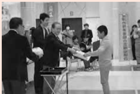
▲表彰式にて、市長から入賞者に賞状を授与。

この催しは、昨年までの障がい者向けイベントを発展させる形で今年から始めたものです。5日は、ポスターとパネルの展示・障がい疑似体験・点字入り名刺作成・手話体験が行われました。6日は、障がい者施設による販売会と、リオデジャネイロパラリンピックに