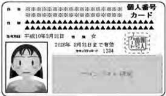
▲個人番号カード(見本)

富津市では、本人確認の身分証明書や、e-taxなどの電子申請に利用できます。今後、社会保障・税・災害対策などで利用される予定です。