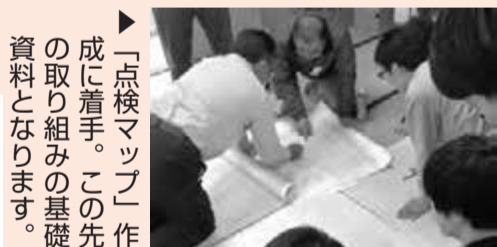
▲「点検マップ」作成に着手。この先の取り組みの基礎資料となります。

農村発「地方創生」の実現に向けて、保全会とむら塾の双方が多くの努力を重ねています。