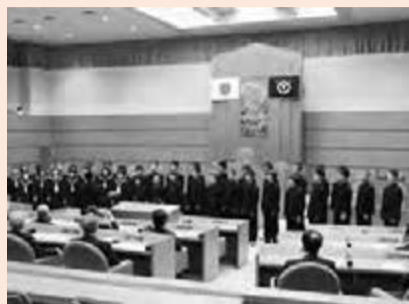
▲全校生徒がこの日のために練習し、議場の皆さんは見事な合唱に聞き入っていました。

昨年12月以来の開催となった今回は、天羽東中学校の生徒が、「青い鳥」「君と歩こう」「心の旋律」の3曲を披露しました。