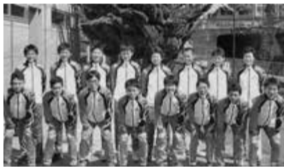
▲ランニングチーム選手の皆さん

対象 市内の小学5年生~高校生 日時 3月14日(土)14:00~16:00 (13:30~受け付け、参加費無料) ※雨天時の開催の有無は、当日10:00以降に問い合わせください。 場所 市民ふれあい公園内 臨海陸上競技場 定員 100人(申し込み先着順) 講師 JR東日本ランニングチーム 内容 ランニング歴や年齢などを参考に、各パートに分かれて理論説明、実技実践、トレーニング計画の立案。 持ち物 飲み物・タオル・着替え(運動のできる服装) 申し込み方法 直接市民ふれあい公園窓口へ 問 同公園管理事務所 ☎87-4205