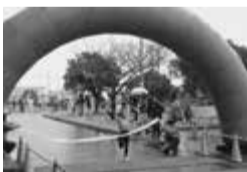
▲千葉県民マラソン