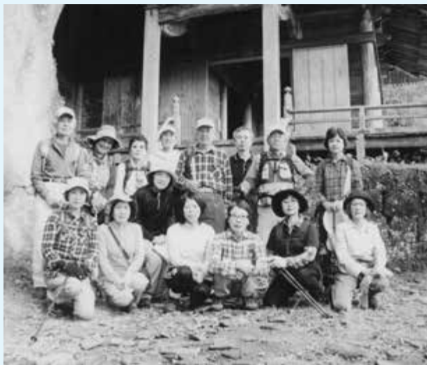
▲高宕山の高宕観音前で