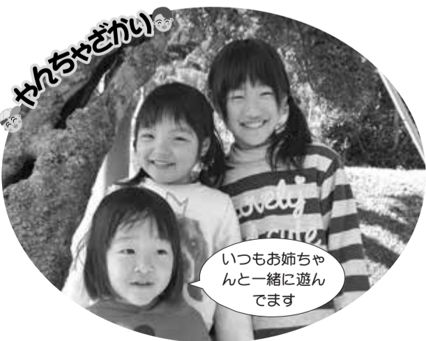
いつもお姉ちゃんと一緒に遊んでいます