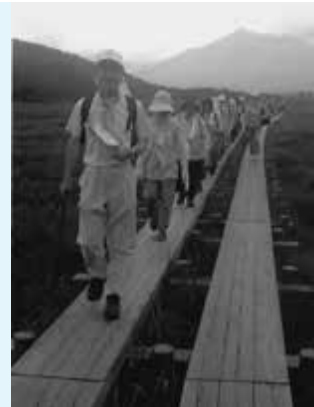
▲尾瀬を歩く、会の皆さん