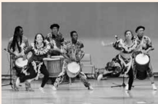
▲市民会館のジャンベの演奏とダンス。

このうち1日午後の市民会館では、「太鼓共演」と題して、市内の上飯野と岩瀬の和太鼓演奏と、アフリカのギニア人が参加しているグループによる「ジャンベ」という太鼓の演奏が披露されました。力強い音色と掛け声が響