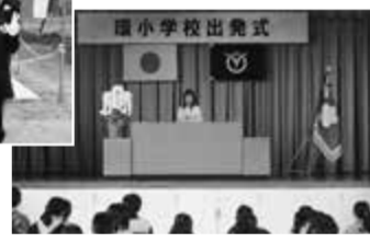
▲統合した環小学校の出発式