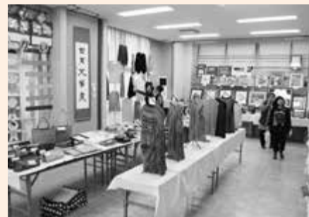
竹岡コミュニティセンター内には、数多くの作品が展示されました。

また、竹岡地区では、11月1日・2日に、竹岡コミュニティセンターでも文化祭が開催されました。竹岡地区の活性化の一つとして長く続いており、市民文化祭同様の作品展示に、屋外で、餅つき・歌のステージ・フラダンスの披露など、多彩な催しが行われました。