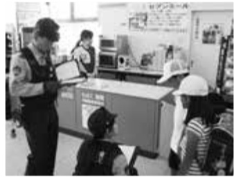
▲飯野小学校児童の、セブン-イレブンへの駆け込み訓練

災害対策の一環として、1月に「広告付避難所等電柱看板に関する協定」、4月に「富津市地域防災計画に基づく災害時歯科医療救護活動に関する協定」、11月に「災害時における衛生機材及びレンタル機材の供給に関する協定」を締結した。 7月には児童の安全対策として、緊急時にセブン-イレブンが児童を保護し、保護者・学校・警察へ連絡を行う内容の協定を、全国初となる市・富津警察署・(株)セブン-イレブン・ジャパンの三者間で締結した。