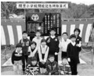
▲関豊小学校の閉校式典にて