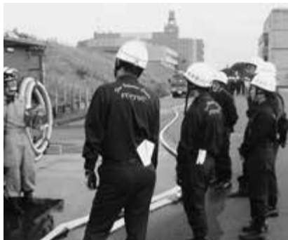
㊦消防本部総務予防課☎88・6403

消防団は、地域の防災力の中核となり、災害から自分たちのまちを守っています。 火災予防や防災活動に取り組むなど、地域防災の担い手として力を貸していただける女性をお待ちしています。