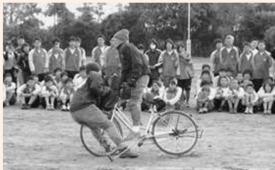
▲自転車と歩行者の事故を目の前で実演

当日は、無灯火運転や携帯電話・傘などの「ながら運転」といった違反行為による事故、死角からの飛び出しによる事故などの実演が行われました。生徒からは、「事故の瞬間を見たことがなく、思った以上でびっくりしました。本当に怖いと思いました。」「毎日乗っている自転車が、人を傷つけ、命を落とすことがあることを改めて実感しました。」などの感想がありました。