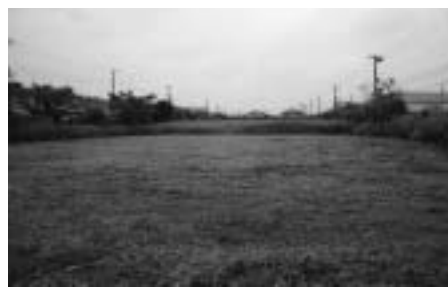
▲写真は物件1～3を合わせたもの