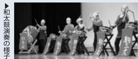
▶和太鼓演奏の様子