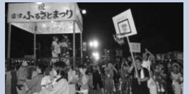
▲『新富津音頭』の練り歩き