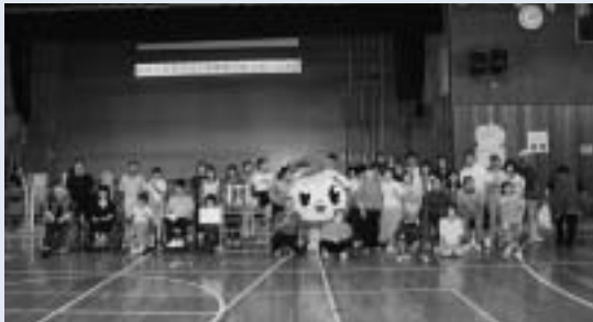
▲優勝できてみんな笑顔！ふつつも大喜び

7月5日、袖ヶ浦市長浦臨海スポーツセンターで第37回君津地域心身障がい児者スポーツ大会が開催されました。富津市からは身体障害者福祉会や、ろうあ協会、あきつの会、三津友会、どんぐりの郷、ペーターの丘、和楽などから38人が介助者たちと参加し、優勝しました。来年は君津市で開催する予定です。