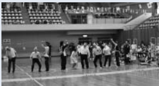
▲全員参加の競技「パン食い競争」で、みんな一生懸命