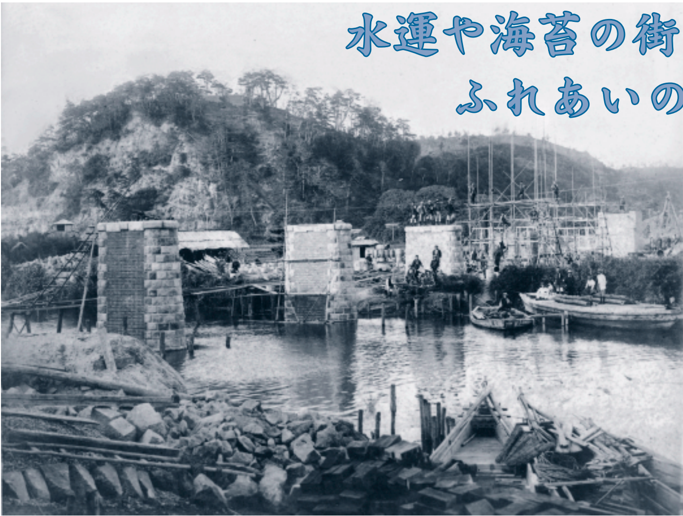
▲大堀側から撮影した、小糸川にかかる鉄道橋梁の建設現場。両岸に渡し舟があります。

大堀と青木・西川で構成される青堀地区。かつては、小糸川を利用した水運や海苔養殖などが盛んなところでした。高度経済成長期以降は、市街地が広がり、多くの人が移り住むようになりました。市内で最も人口が多い地区となった現在も、新しい住宅が増え続けています。 ☎情報課 80・1225