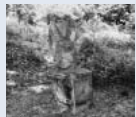
▲義行さんが制作したオブジェ

所在地 亀田1237番地（駐車場8台） ※付近の道は狭くなっていますので、車の走行に注意してください。 開館時間 11:00~17:00 (入館無料 火・水曜日定休日) ☎ カフェ GROVE ☎66・0936