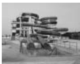
▲富津公園ジャンポール開園中！