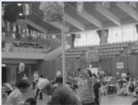
▲「籠がいつぱいになった」「玉入れ競技」

7月5日、袖ヶ浦市長浦臨海スポーツセンターで第37回君津地域心身障がい児者スポーツ大会が開催されました。富津市からは身体障害者福祉会や、ろうあ協会、あきつの会、三津友会、どんぐりの郷、ペーターの丘、和楽などから38人が介助者たちと参加し、優勝しました。来年は君津市で開催する予定です。