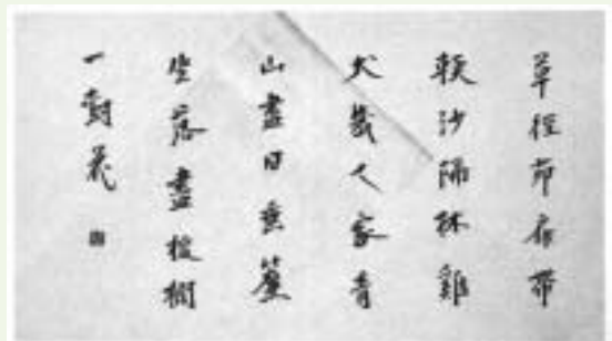
▲受賞作品の『王沂詩』（帖：部分）