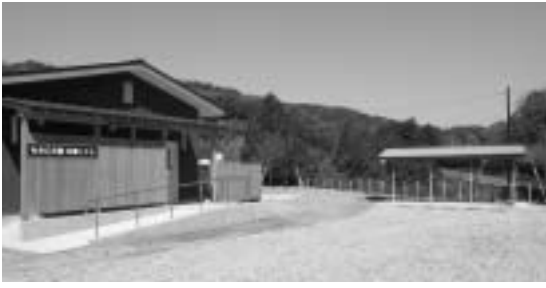
▲トイレの設置に伴い水汲み場も移動する予定です