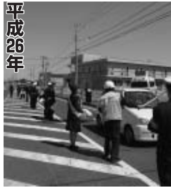
▲昨年の様子（市役所前）