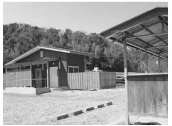
▲左が公衆トイレ。右は志駒不動様の霊水の水くみ場

秋の紅葉シーズンをはじめ、年間を通して多くの観光客が訪れる、志駒・山中地区の通称「もみじロード」沿いに、公衆用トイレを設置しました。