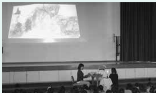
▲児童と、来校した保護者の皆さんは読み聞かせに聞き入っていました