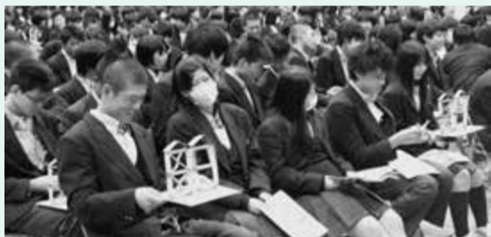
▲家の模型を使った、筋交いの有り無しによる揺れ方の違いを知る実験

地震に関する実験も行われ、マグニチュード(=地震の規模)が示す数字の意味を知るために、1人→1クラス→全校生徒と、人数を増やしながら一斉にジャンプする実験など、実感しやすい方法で、防災に役立つ知識を学んでいました。