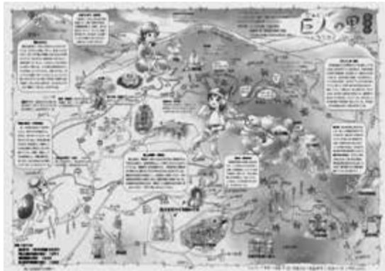
▲「巨人の里」をテーマにした峰上地区のマップ

さらに、来庁時に窓口の配置場所が分かりやすいように、9月に本庁舎案内マップを作成し、庁内で配布しています。