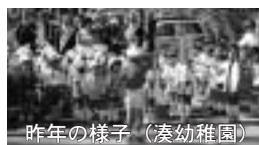
昨年の様子(奏幼幼稚園)

富津保育園児の鼓笛隊パレードが、交通事故防止を呼びかけます。 日時 9月24日(火)午前10時～ 場所 大乘寺境内・富津公園第1駐車場 問市民課 ☎80・1276