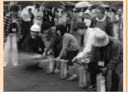
▲昨年の総合防災訓練の様子

日時 10月6日(日) 午前8時30分～11時30分 場所 富津小学校 内容 津波浸水被害を想定した避難訓練と消火器取り扱いや地震体験などの訓練 ※当日、富津地区では防災行政無線からサイレンや緊急地震速報などが流れます。 問防災課 ☎ 80・1266