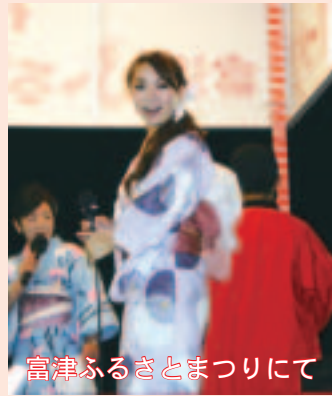
富津ふるさとまつりにて