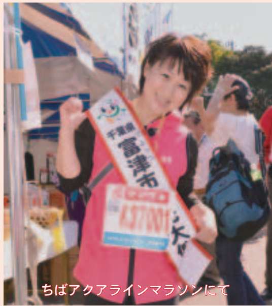
ちばアクアラインマラソンにて

文化放送「走れ！歌謡曲」でグランプリを獲得し2004年デビュー、2007年富津市観光協会の観光大使として「福祉コンサート」「大佐和観光夏まつり」などで活躍。市の大使としては「富津岬夏祭り」「産業まつり」などで活躍しています。