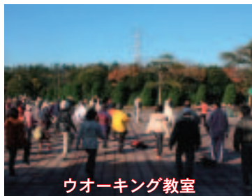
ウォーキング教室