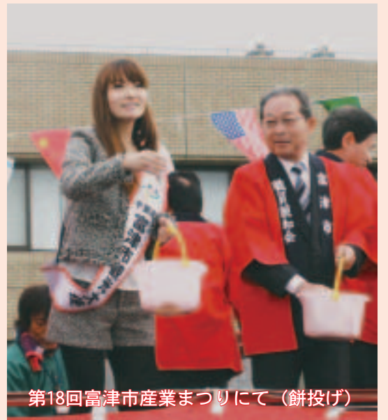
第18回富津市産業まつりにて(餅投げ)

1998年「モーニング娘。」の2期メンバーとしてデビュー、同グループを卒業後2011年OGで構成される「ドリームモーニング娘。」(現在活動休止中)を結成。市内では「富津ふるさとまつり」や「産業まつり」で活躍しています。