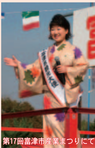
第17回富津市産業まつりにて

ありがとうございました。ご活躍期待しています。 ふつつんも富津市をPRするためにがんばります！