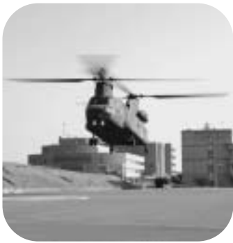
▲駐車場に着陸する自衛隊ヘリ

市では、消防防災センター駐車場を災害時などにおける自衛隊ヘリコプター場外離着陸場に指定するよう計画しています。災害発生時の自衛隊の救援活動を円滑に行うため、9月12日、第1ヘリコプター団所属ヘリコプター2機による離着陸訓練が行われました。