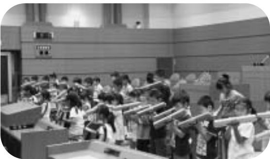
▲児童による演奏の様子

市議会本会議が開催された9月5日、金谷小学校全校児童42人による議場コンサートが開催されました。児童代表が観光地としての金谷をPRした後、合唱「いつでもあの海は」「あすという日が」と、鍵盤ハーモニカ・アコーディオンなどによる「デイズニー・メドレー」の合奏が行われました。