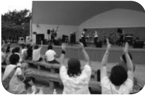
▲大迫力のロックのリズムに、歓声で応える観客

市では、消防防災センター駐車場を災害時などにおける自衛隊ヘリコプター場外離着陸場に指定するよう計画しています。災害発生時の自衛隊の救援活動を円滑に行うため、9月12日、第1ヘリコプター団所属ヘリコプター2機による離着陸訓練が行われました。