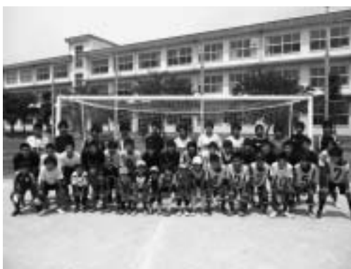
▲夏休みの天羽高校サッカー部と天羽中学校サッカー部との交流会にて

私たちは、2002年日韓ワールドカップ開催の年に設立しました。市内でも天羽地区にはサッカーができる環境がなかったため、子どもたちの健全育成とのびのびとした成長に少しでも協力できればと小学生と未就学児を対象としたサッカークラブです。