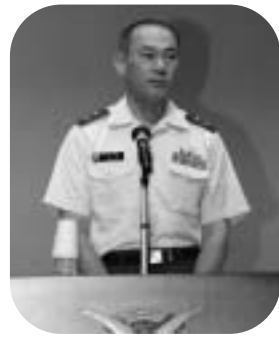
▲団長による講演の様子