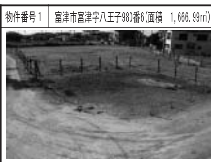
物件番号1 富津市富津字八王子980番6(面積 1,666.99㎡)

市では所有の不動産（土地）を入札により売却します。個人・法人を問わず参加できます。詳細は、入札案内書をご覧ください。 ●入札期間 6月14日(木)～25日(月) ●入札書などの提出 管財契約課 ●開札会場 市役所本庁舎5階 入札室 ●入札案内書の配布 管財契約課 ●物件現地説明会 6月8日(金) 詳細は問い合わせください。 ●入札書提出先 管財契約課 ☎80・1239 http://www.city.futtsu.lg.jp/