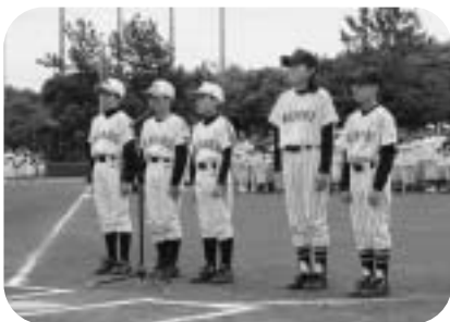
▲市内代表2チームでスポーツ少年団の綱領を宣言