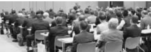
4月26日区長会議の様子

皆さんの声を行政にお届けし、市役所との連絡調整などを行います 問市民課 ☎80・1252