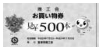
▲デザインは変更になる場合があります