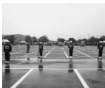
問消防署 ☎65・0119 の部9隊、小型ポンプの部6隊)

日頃、地域の皆さんからの支援を受け、火災、風水害などの災害に備えて、休日返上で日夜訓練に励んできた操法技術を披露します。 日時 6月2日(土)(雨天の場合)は3日(日)午前8時30分～ 場所 富津公民館駐車場 ※駐車場は総合社会体育館前をご利用ください。 内容 操法演技(ポンプ車