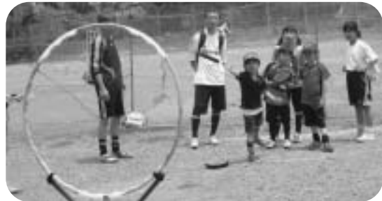
▲ドッチビーゲームで楽しむ子どもたち

優勝は市内亀田から家族3人で参加のチームTKM。「学校からのチラシで大会を知り、初参加で優勝なんてビックリ。今回来られなかった弟とまた参加したいです。」と話していました。