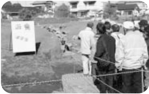
▲古墳の説明を受ける見学者と露出した横穴式石室

県道の新設工事に先立ち、昨年12月から（財）千葉県教育振興財団が一問塚地区で西谷古墳の調査を行っており、2月4日に現地説明会が開かれました。露出した横穴式石室や盛り土を囲う周溝が見学者に公開され、古墳の概要や調査の成果の説明がありました。また、須恵器という当時の土器と、重さ約400kgにもなる石室の天井石などが展示されていました。