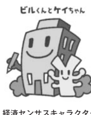
経済センサスキャラクター