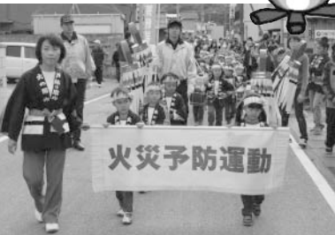
▲11月9日防火パレード(みなと幼稚園)

これから空気が乾燥してくると、枯草が燃えやすい状態になります。建物の敷地内や建物などの近くに、枯草が繁茂していると火災予防上、大変危険です。また、刈り取った枯草などから火災とならないよう十分気をつけてください。