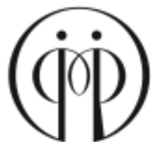
男女共同参画 男女共同参画シンボルマーク

この週間は、さまざまな取り組みを通じて、男女共同参画社会基本法の目的や基本理念についてみなさんの理解を深めることを目指し、内閣府が主唱し実施するものです。