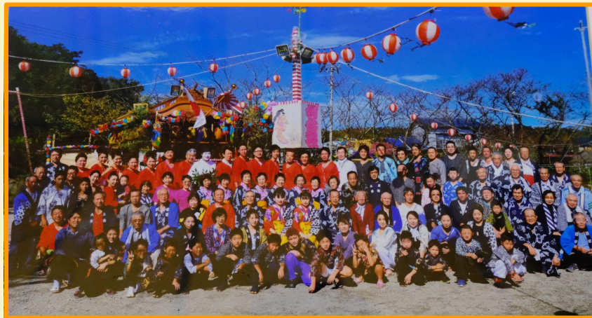
↑ 平成30年 数馬区祭礼