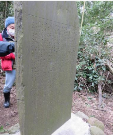
安泰寺跡・小笠原氏墓所