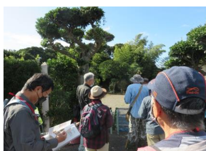
内裏塚古墳・珠名ちょう碑