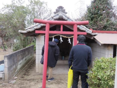
里見家・稲村家墓地