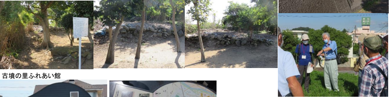
古墳の里ふれあい館