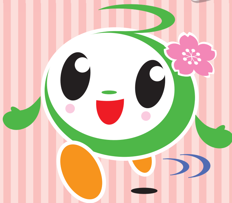
《令和6年度 商品注文・変更 受付締切日》