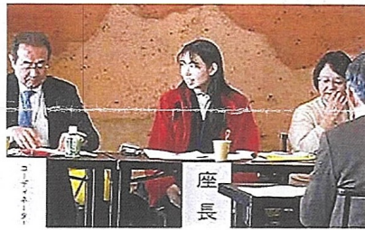
右の方が木更津市の事例発表者

木更津市と船橋市の報告発表がありました。「一人親、子供は発達障害、家はゴミ屋敷、親を呼べない、金がない」というような、問題が重なっている家庭にオールラウンドで支援する事業とのこと。問題によって社協以外の市役所の組織、弁護士、医師、保健所に呼びかけてアドバイスを受けながら家族と対話を進めて行く。