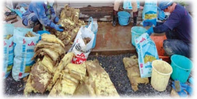
浸水したグラスウール