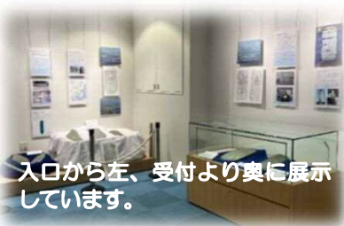
入口から左、受付より奥に展示しています。

イオンモール富津3階・富津市立図書館内の郷土資料コーナーでは、市内の貴重な文化財を展示しています。現在は、新しく指定文化財となった板碑(いたび)を展示・解説しています。