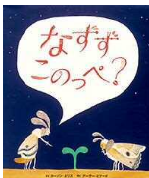
なすすこのっぺ カーソン・リス/作 アーサー・ピナード/訳 (フレーベル館)

「なすすこのっぺ(なにこれ?)」それに別の虫が答えます。「わっぱどがらん(さっぱりわからん)」聞いたこともない昆虫語を聞いていると、そのうち何を話しているか、何となく分かる気がしますませんか?