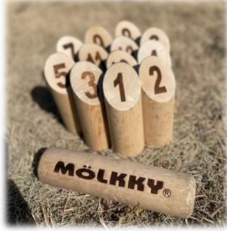
モルックとスキットル

参加した皆様は、狙ったスキットルを当てる事ができた、外れたと歓声が沸き、会場は参加した皆様の笑い声に包まれていました。