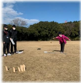
第1回富津モルック大会の様子