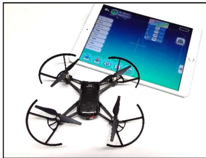
実際に使用したドローンとタブレット