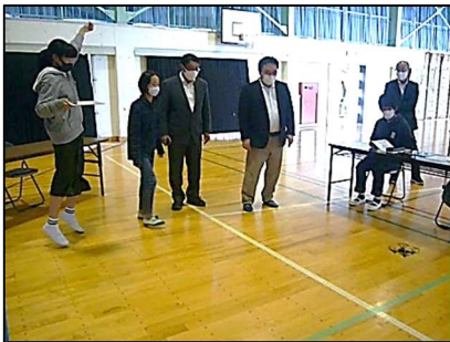
佐貴小学校の授業の様子