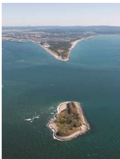
富津岬と第一海堡