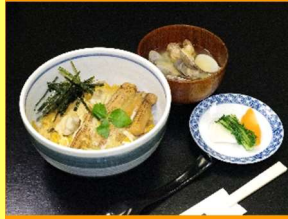
焼きはかりめとあさりの玉子とじ丼 1,674円

あさりのむき身と当店自慢の“焼きはかりめ”を玉子とじにし、どんぶりにしてあります。あさりの味噌汁、香の物付きです。