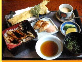
はかりめづくし 2,160円

その日富津港で水揚げされた、旬の魚介類を提供します。特に穴子料理は様々な料理を取り揃えております。