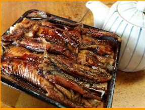
はかりめひつまぶし 1,960円

ここでしか食べられない一品！特製ダシをかけてお茶漬けでどうぞ♪3つの味が楽しめるはかりめ丼です！