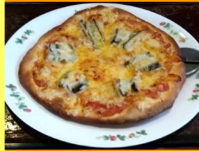
手打ちはかりめピザ 1,620円

穴子とよく合うチーズは、防腐剤等添加物を含まないナチュラルチーズ。手作りマトソースに、手打ち生地は本場イタリア産のカポリー00粉。香り強く風味があります。