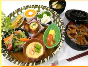
はかりめ生湯葉御膳 2,500円

健康志向を重視した野菜を中心に作った「ヘルシーランチ」と「はかりめ」がコラボ！黒米雑穀と合わせて、身体に優しいメニューです。