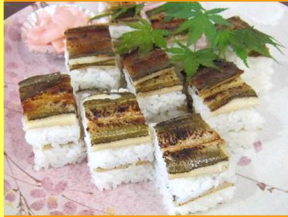
あぶり博多寿し 1,280円

ふっくらと柔らかく炊き上げたあなごを炙り、香ばしく仕上げた押し寿司です。甘いタレとよく合います。