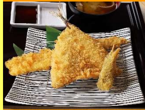
房総シーフードミックスフライ定食 1,609円