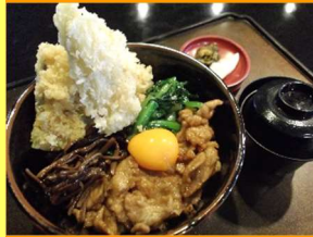
スタミナはかりめ丼 1,300円

富津の穴子を使用した和韓のハーモニーを混ぜて美味しいスタミナ丼！若者から年配の方まで食べやすい味に仕上げました。