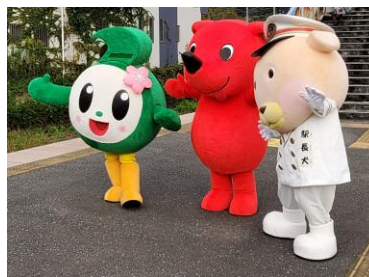
▲浜金谷駅でのお見送りの様子