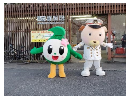
▲竹岡駅でのお見送りの様子