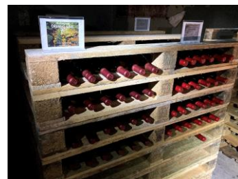
▲鋸山ワイン貯蔵庫

帰りには、浜金谷駅のホームで「チーバくん」、「ふつつん」、JR東日本千葉支社マスコットキャラの「駅長犬」がお見送りしました。