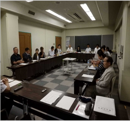
第1回代表部会の様子