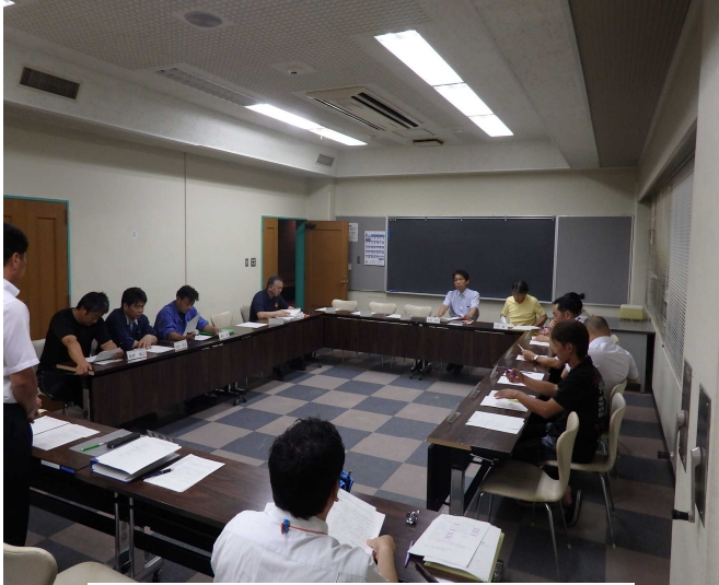
第1回代表部会の様子