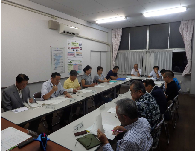
第1回代表部会の様子