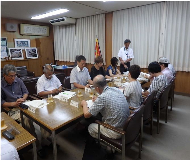
第1回代表部会の様子