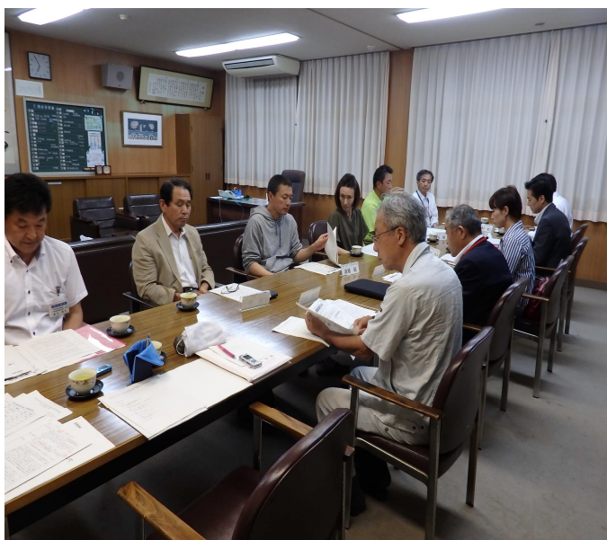
第1回代表部会の様子