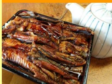
はかりめひつまぶし 1,960円

ここでしか食べられない一品! 特製ダシをかけてお茶づけでどうぞ♪3つの味が楽しめるはかりめ丼です!