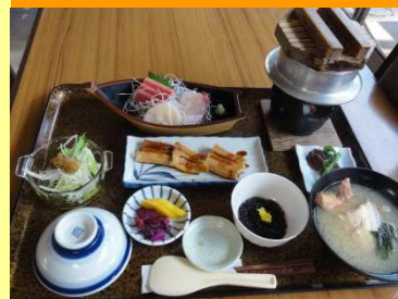
岬はかりめ定食 3,240円

富津岬にある宿泊施設です。料理の内容はご要望・予算により用意いたします。お気軽にお問い合わせ下さい。