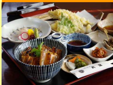
はかりめづくし膳 4,266円

活けはかりめを使った刺身・白焼き・焼き穴子丼・天ぷら・煮物・小鉢・味噌汁・香の物がセットになった和膳です。