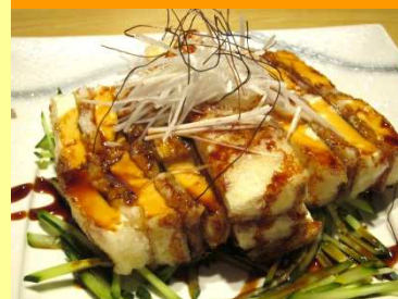
豆腐と穴子の包み揚げ 700円

柔らかい豆腐とサクサクした穴子の食感が同時に味わえます。染み出る特製だれが二つの味を鮮やかにします。