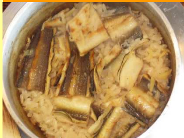
はかりめ釜飯 一合炊き 1,296円

魚沼産コシヒカリで炊く穴子釜飯。本枯れ鰹節出汁でふっくら炊き上げました。白焼き・天ぷらもご提供しております。