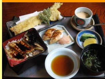
はかりめづくし 2,160円

その日富津港で水揚げされた、旬の魚介類を提供します。特に穴子料理は様々な料理を取り揃えております。