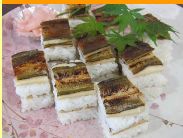
あぶり博多寿司 1,280円

ふっくらと柔らかく炊き上げたあなごを炙り、香ばしく仕上げた押し寿司です。甘いタレとよく合います。