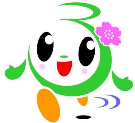
富津市おもてなしキャラクター