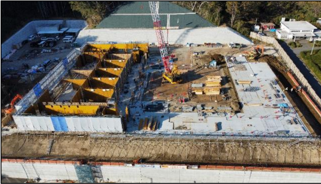
火葬棟(1階)のコンクリート打設 (令和3年12月)