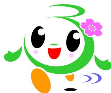
富津市おもてなしキャラクター ふつつん