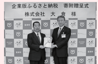
株式会社大倉様 200万円

① 教育振興(公民館)へ 話法グループクレマチス様 オーディオテクニカ ハンズフリー拡声器一式(30,000円相当)