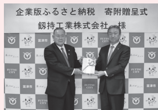
鈮持工業株式会社様