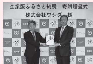
株式会社ワシダ様