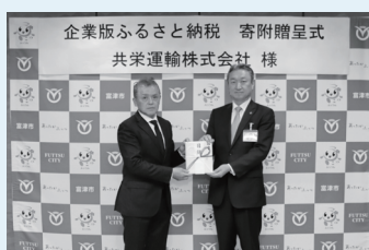
共栄運輸株式会社 様 1,100万円