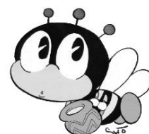
生涯学習マスコット 「マナビィ」

※掲載した内容は、令和4年3月末現在の情報です。 問い合わせ先: 富津市教育委員会生涯学習課 ☎ 0439-80-1345 富津市ホームページ: http://www.city.futtsu.lg.jp/