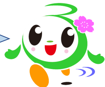
富津市おもてなしキャラクター 「ふつつん」