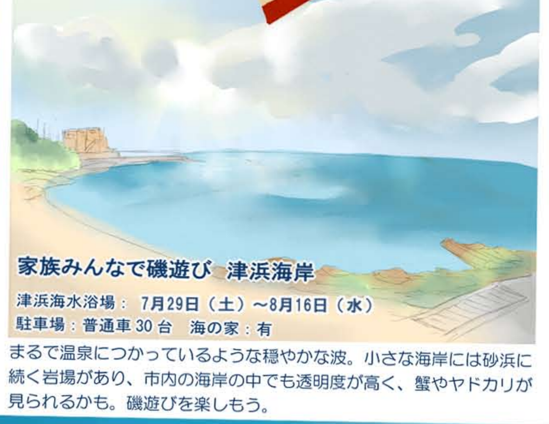
家族みんなで磯遊び 津浜海岸 津浜海水浴場：7月29日（土）～8月16日（水） 駐車場：普通車 30台 海の家：有

JR上総湊駅から徒歩で行けて商店街にも近く、隣接する公園にシャワーと更衣室があり小さな子ども連れに便利です。公園には芝生広場と遊歩道などがあり、運動もできます。