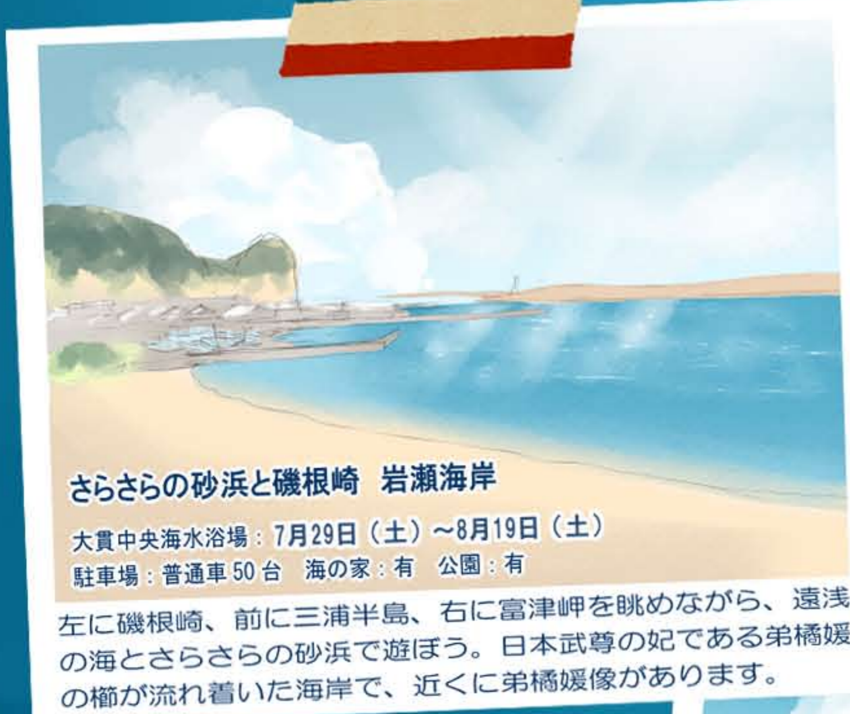
さらさらの砂浜と磯根崎 岩瀬海岸 大貫中央海水浴場：7月29日（土）～8月19日（土） 駐車場：普通車 50台 海の家：有 公園：有

遊泳区域外ではマリンスポーツも楽しめる波高の海。潮干狩り場にも近く、富津公園内にテニスコート・温水プール・キャンプ場があり夜も楽しめます。