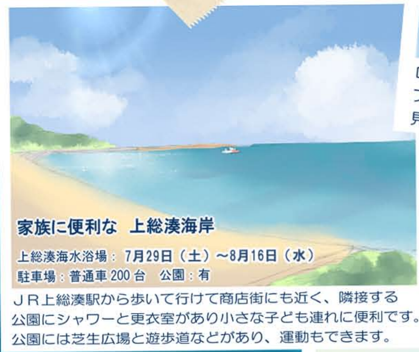
家族に便利な 上総湊海岸 上総湊海水浴場：7月29日（土）～8月16日（水） 駐車場：普通車 200台 公園：有

ロケーション必見！CMに使われる海岸。運が良ければ対岸に横浜ベイブリッジやランドマークタワーを見ることができるかも。東京湾観音が見守る海の景色を楽しみながら、のんびり過ごそう。