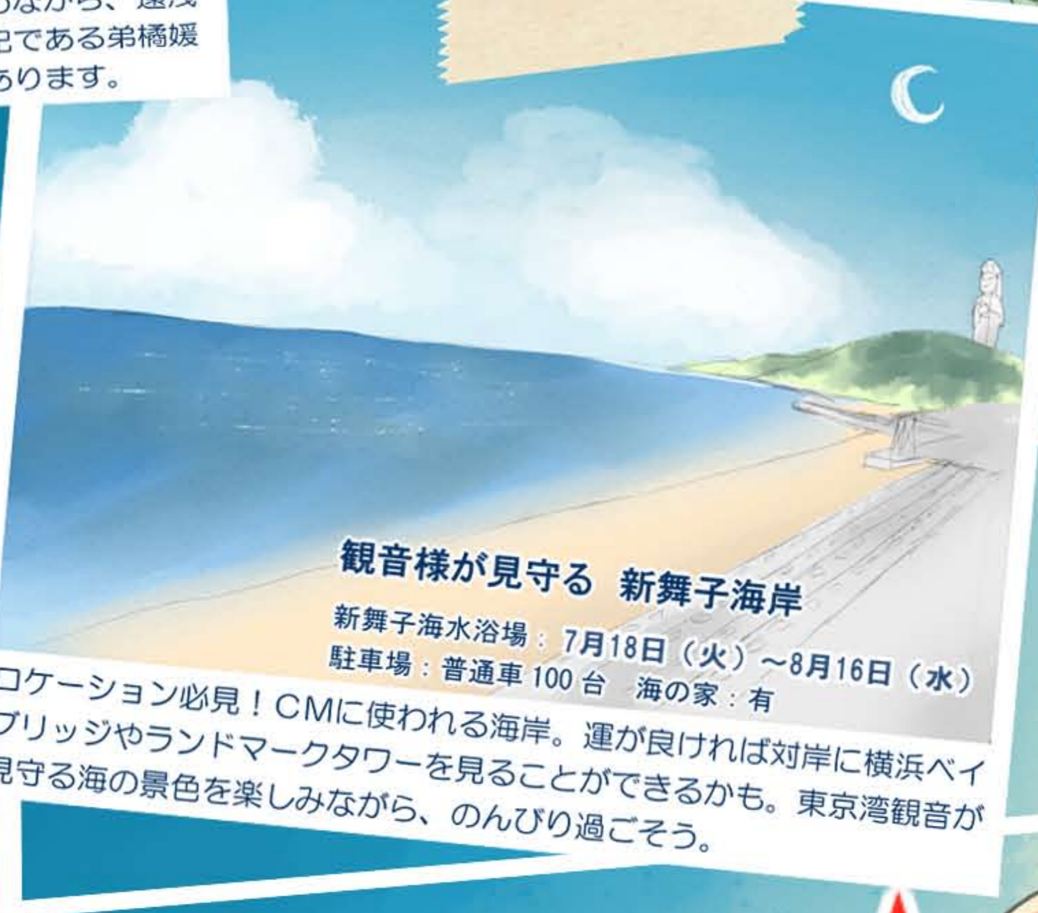
観音様が見守る 新舞子海岸 新舞子海水浴場：7月18日（火）～8月16日（水） 駐車場：普通車 100台 海の家：有

左に磯根崎、前に三浦半島、右に富津岬を眺めながら、遠浅の海とさらさらの砂浜で遊ぼう。日本武尊の妃である弟橘媛の櫛が流れ着いた海岸で、近くに弟橘媛像があります。