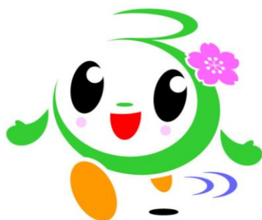
富津市おもてなしキャラクター ふつつん