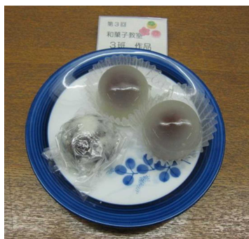
和菓子教室 7月24日 水饅頭・じょうよ吹雪饅頭