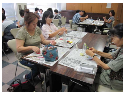
プリザーブドフラワー 8月22日 「ハーバリウム」