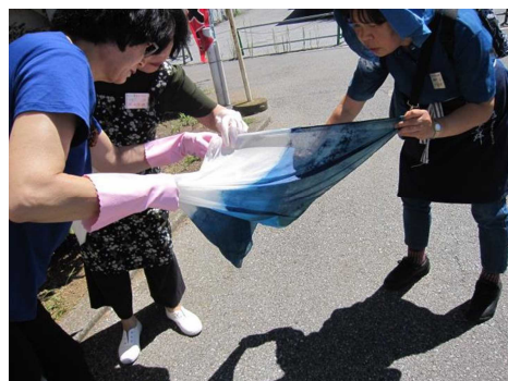
季節の草木染め講座 8月22日 藍染め 日光に当て変色を促す