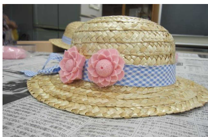
はじめてのソーパークーピング 9月6日作品「ひまわり」